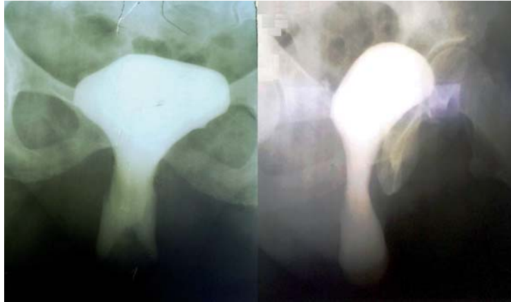
Рис. 1. Цистограмма: прямая и боковая проекция. ПОМТ в виде цистоцеле IV стадии

отмечается воронкообразное расширение мочеиспускательного канала у всех пациенток данных групп (рис. 1, 2).