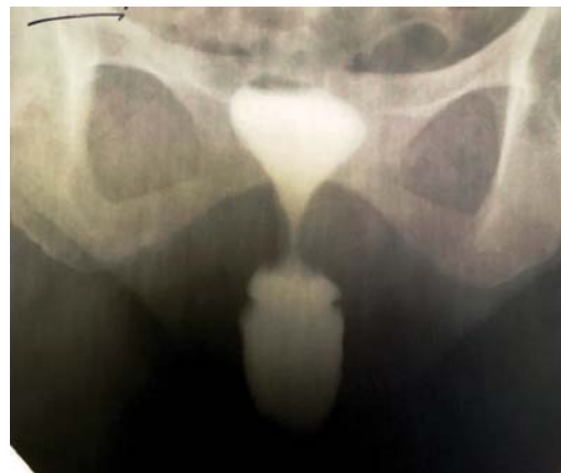
Рис. 2. Цистограмма: прямая проекция. ПОМТ в виде цистоцеле IV стадии. Симптом «песочных часов»

При проведении урофлоуметрии были получены данные, свидетельствующие о нарушении мочеиспускания во 2-й, 3а, 3б группах. Во 2-й, 3а группах преобладал нормальный тип мочеиспускания. В 3б группе у всех пациенток