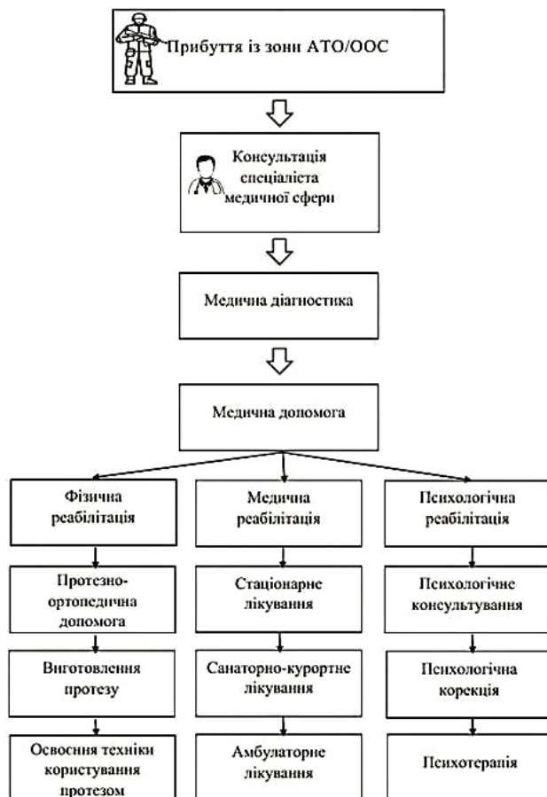
Рис. 2. Схема вибору програми реабілітації